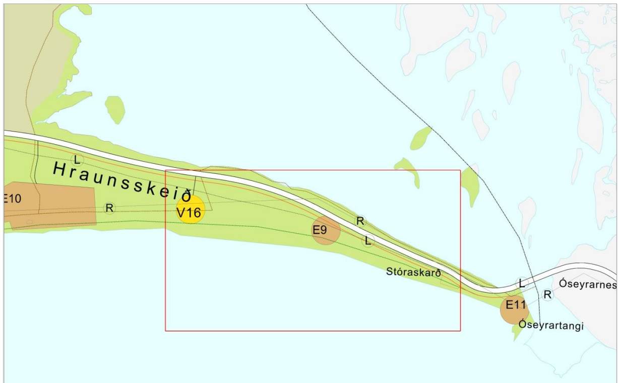
Mynd 1. Gildandi Aðalskipulag Sveitarfélagsins Ölfuss 2010-2022. Rauði ramminn sýnir svæðið sem breytingin tekur til.

Undanfarna áratugi hefur verið unnið að uppgræðslu á svæðinu til að hefta sandfok. Enn er þó hættu á sandfoki í slæmum veðrum.