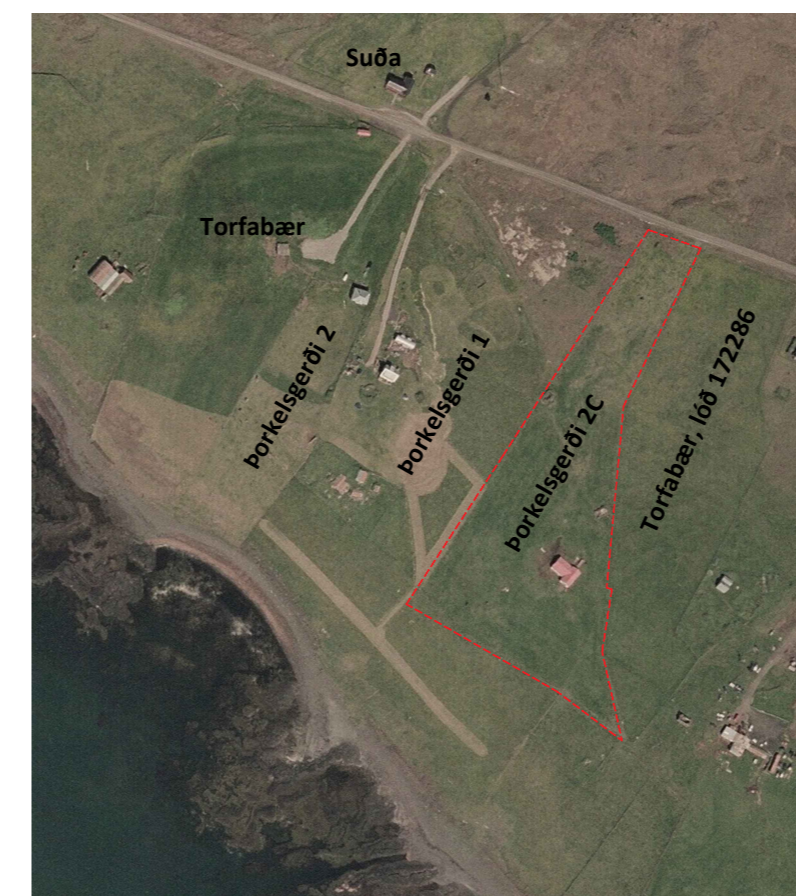
Afmörkun deiliskipulags 1:5000