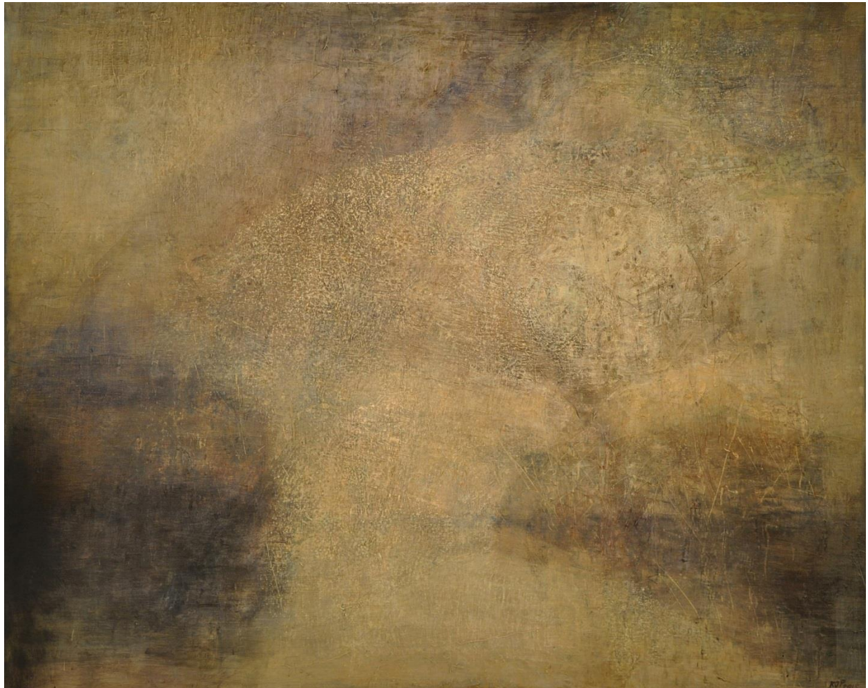
Án titils. Olíumálverk 170 x 2010 cm. 2015.