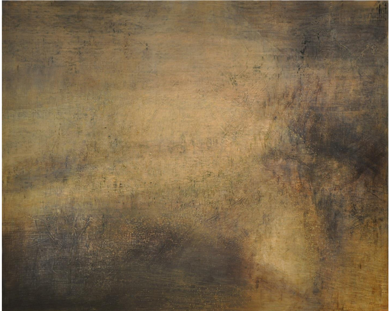
Án titils Olíumálverk 170 x 210 cm. 2014.