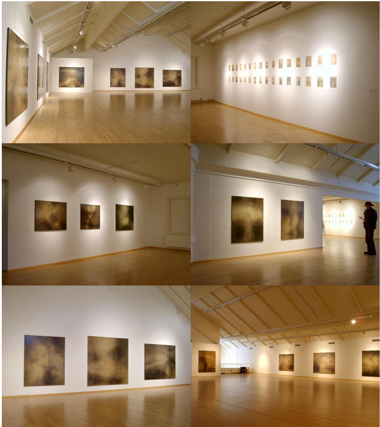
Hraun og mynd. Hafnarborg, menningar – og listamiðstöð Hafnarfjarðar 2016