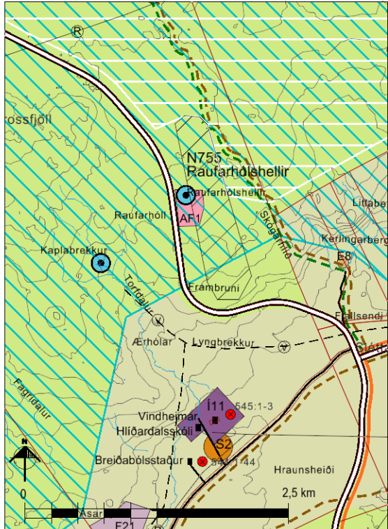
Breytt Aðalskipulag Ölfuss 2010-2022 í mkv. 1:50.000.