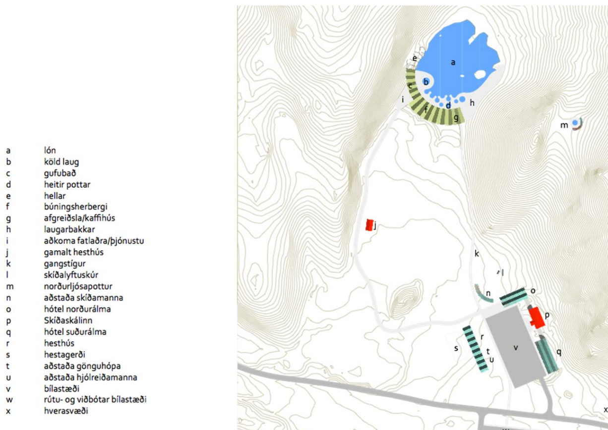
Mynd 3. Frumtillaga að uppbyggingu svæðisins sýnt til skýringar, mynd teiknuð af Studio Granda.

Nánast öll uppbyggingin er á þegar röskuðu svæði sem hefur verið útivistarsvæði íbúa á suður- og vesturlandi í áratugi. Svæðið er í mikilli nálægð við virkjanasvæði á Hellisheiði. Reiknað er með að byggja um 100 herbergja hótél en Skíðaskálinn verður áfram sjálfstæður veitingastaður í endurbættri mynd. Byggja á um 10.000 m 2 lón í botni Stóradals. Lónið og bygging sem því fylgir á að vera nánast hulið frá þjóðveginum, lágrest hús sem fellur vel að umhverfi. Hugmyndir eru um að nýta heitt affallsvatn sem fellur frá Hellisheiðarvirkjun, rétt er að hafa inni að vatn sem nota á í lón komi frá Hellisheiðavirkjun, þetta kallast skiljuvatn og má segja að þetta sé úrgangsvatn sem ætlunin er að endurnýta. Um er að ræða lón sem myndast á yfirborði.