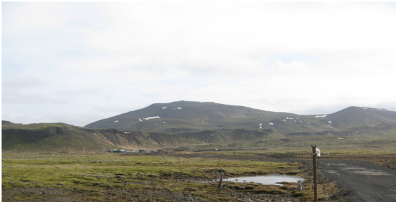
Mynd 4. Horft suðaustur eftir svæði fyrir Ökukenningarfélagið í átt að núverandi aðstöðu Vík.