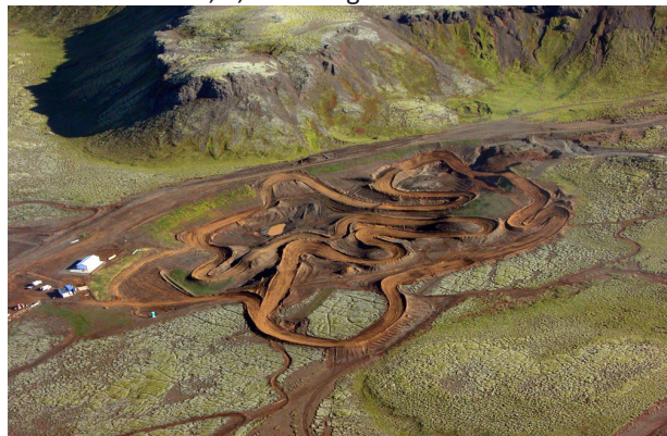
Mynd 4. Yfirflugsmynd yfir keppnisbraut Vík.

Motorcross 85 cc, 1,4 km löng malarbraut.