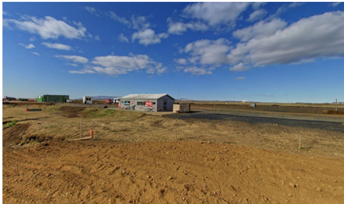
Mynd 4. Núverandi aðstaða Vélhjólaiþróttaklúbbsins.