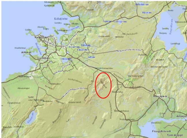
Mynd 1. Afstöðumynd af svæðinu.