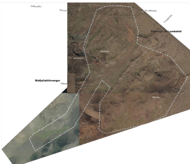
Mynd 1. Afmörkun deiliskipulagssvæðis.