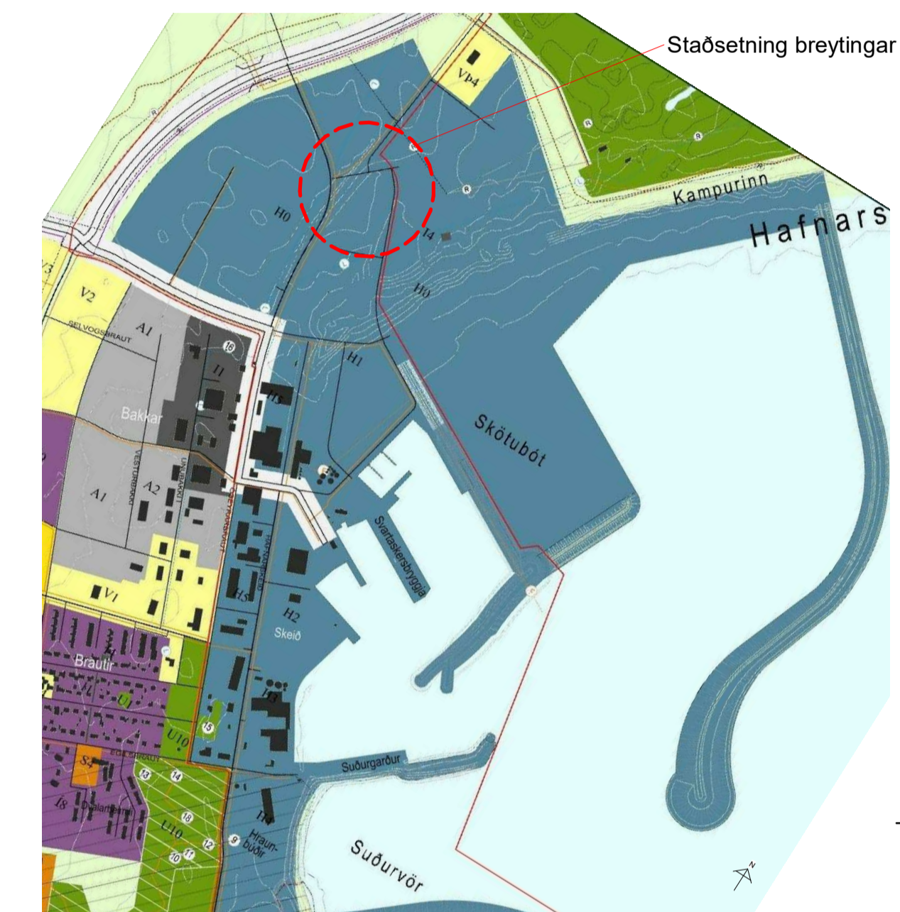
Hluti úr aðalskipulagi Ölfuss 2010 - 2022, með síðari breytingum, þéttbýlisuppráttur. Ekki í kvarða.

Greinargerð deiliskipulags breytist ekki að öðru leiti en hér kemur fram.