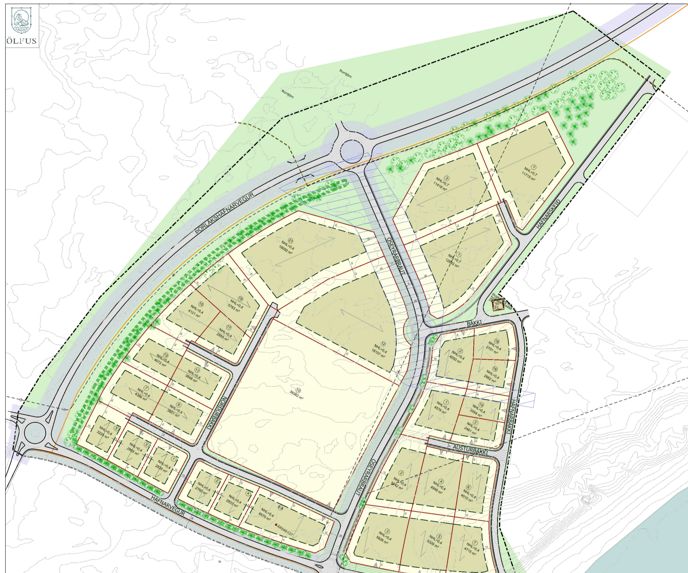
Hluti gildandi deiliskipulags "Hafnarsvæði Þorlákshafnar" samþykkt í Bæjarstjórn Ölfuss 25.júní 2020.

Auglýsing um gildistöku breytingarinnar var birt í B-deild stjórnartíðinda þann _____ 20__.