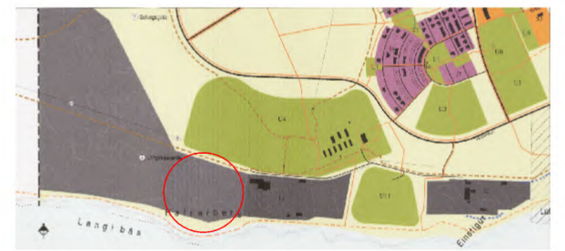
SVEITARFÉLAGIÐ ÖLFUS AÐALSKIPULAG 2010-2022 - Þéttbýlisuppráttur