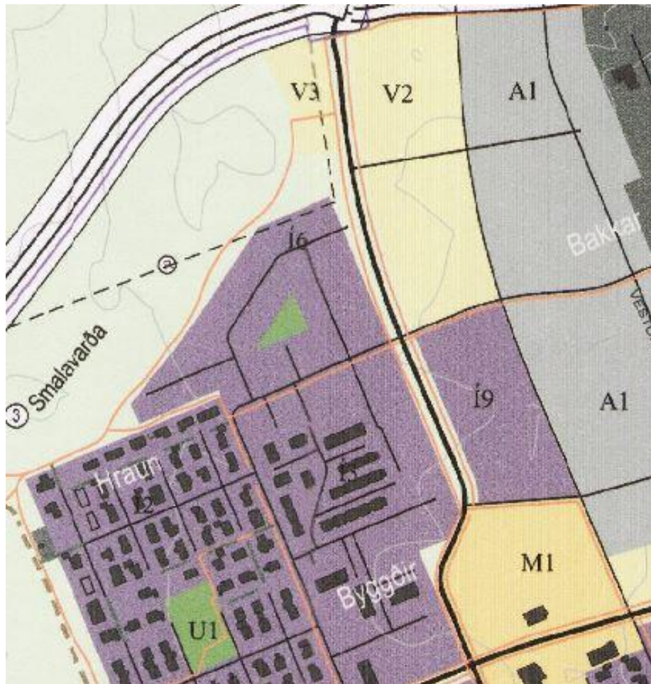
Mynd 1. Hluti úr Aðalskipulagi Ölfuss 2010-2022, þéttbýlisuppráttur af Þorlákshöfn.