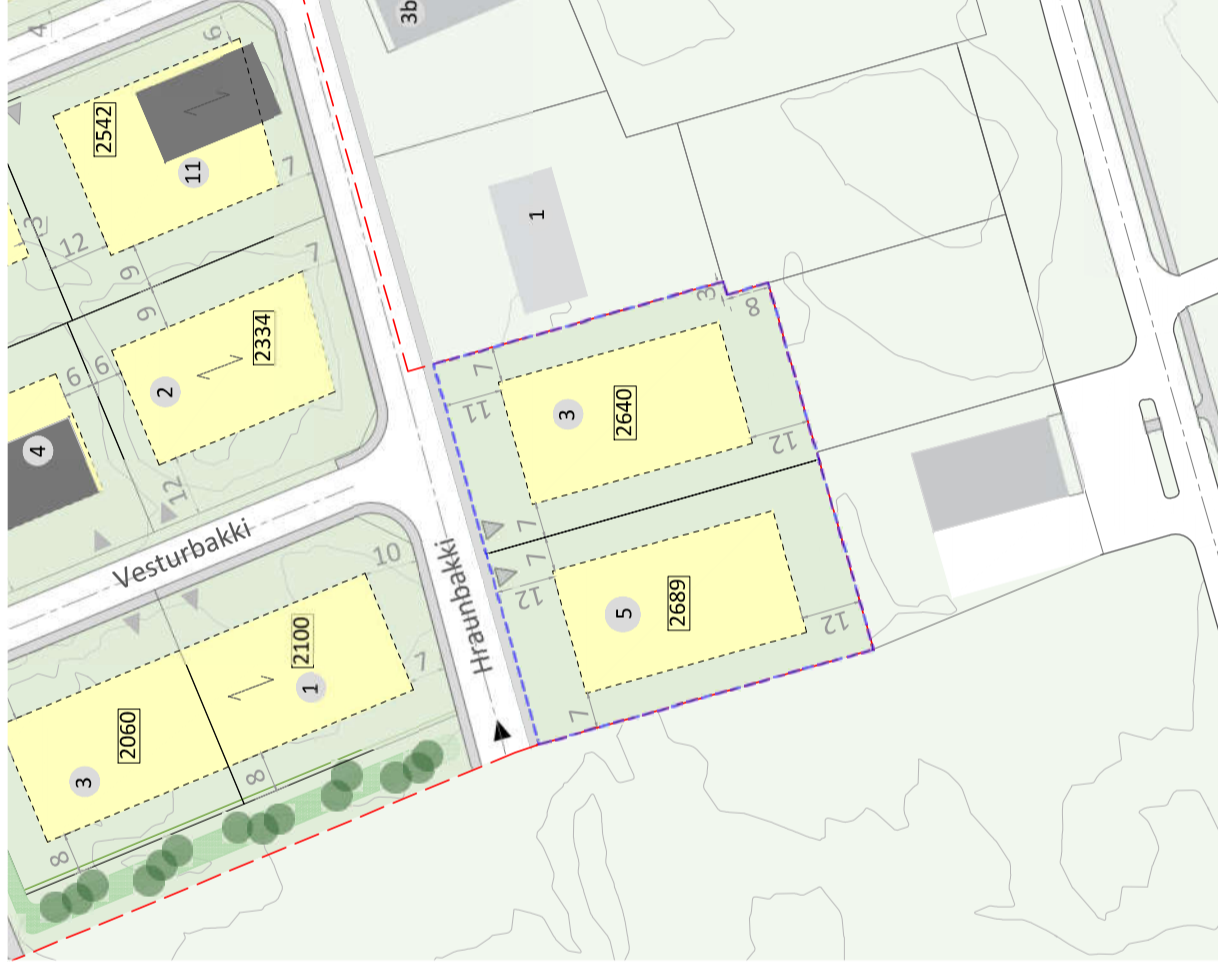
DEILISKIPULAG, Eftir breytingu skipulag 1:1500 á A3