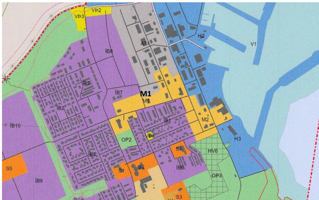
Mynd 4. Hluti af gildandi Aðalskipulagi Ölfus 2020-2036, þéttbýlisuppdráttur Þorlákshöfn