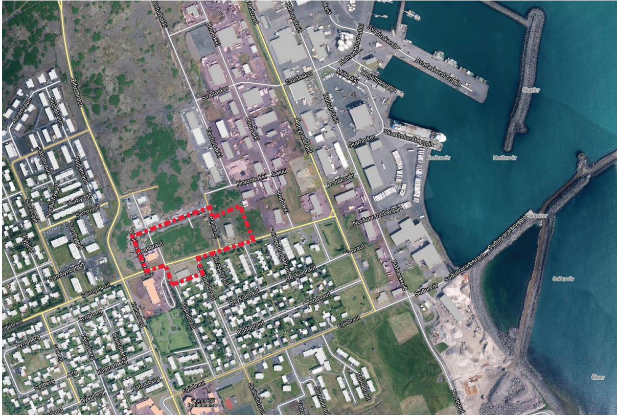
Mynd 2 Staðsetning fyrirhugaðs skipulagssvæðis afmarkað grófllega með rauðri brotalínu

Með deiliskipulaginu er verið að skapa grundvöll til frekari uppbyggingar í miðbæ Þorlákshafnar