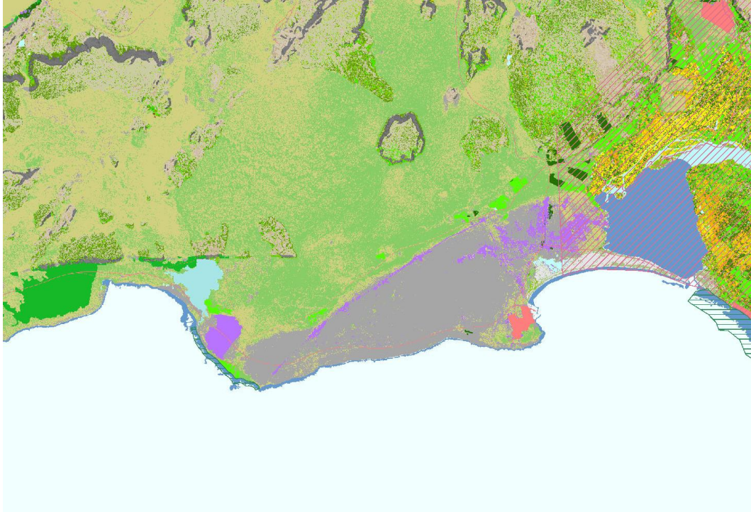
Vistgerðakort Náttúrufræðistofnunar Íslands. Skipulagssvæðið er innan rauða hringsins.