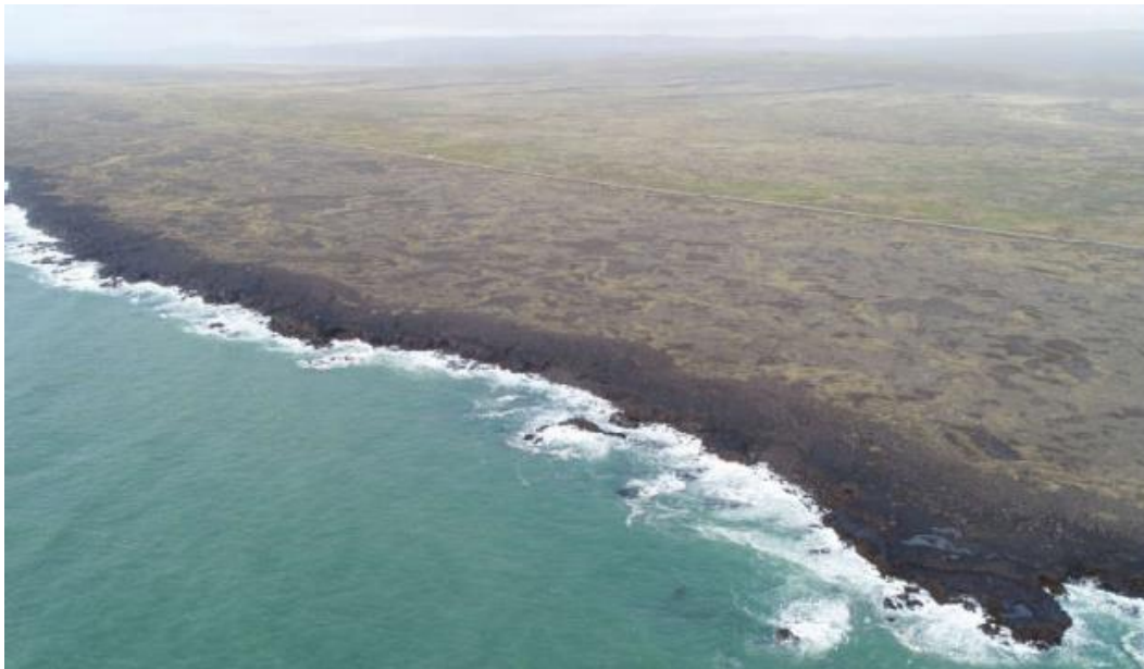
Horft yfir fyrirhugað framkvæmdasvæði.

Framkvæmdasvæðið liggur við sjó og er á svæði sem skilgreint er sem óbyggt svæði í aðalskipulagi og um svæðið liggja göngu- og reiðleiðir. Þann 1. janúar 2022 bjuggu 2.481 manns í Ölfusi, þar af 1.927 manns í Þorlákshöfn og fjölgaði íbúum um 4,7% frá árinu 2021. (Hagstofa Íslands, 2022). Atvinna í sveitarfélaginu hefur einkum byggst upp í tengslum við fiskveiðar og fiskverkun en atvinnutækifærum í öðrum atvinnugreinum hefur fjölgað síðastliðin ár, m.a. í ferðaþjónustu (Aðalskipulag Sveitarfélagsins Ölfuss 2010-2022).