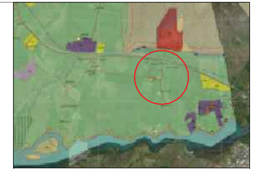
Hluti aðalskipulags Ólfuss 2020-2036 - ekki í skala. Staðsetning deiliskipulagsvæðis sýnd með rauðum hring

1 norðvesturhorn X = 399091.521 Y = 385107.763 2 norðausturhorn X = 399217.025 Y = 385082.131 3 suðausturhorn X = 399205.421 Y = 384999.349 4 suðvesturhorn X = 399082.906 Y = 385023.556