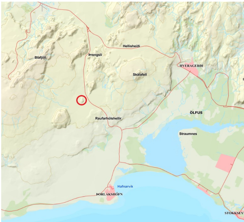
MYND 1 – Yfirlitsmynd, svæðið er afmarkað með rauðum hring. ( www.lmi.is ).

Náman er innan fjarsvæðis vatnsverndar. Aðkoma að svæðinu er frá Þrengslavegi. Náman er á aðalskipulagi sveitarfélagsins skilgreind sem E4.