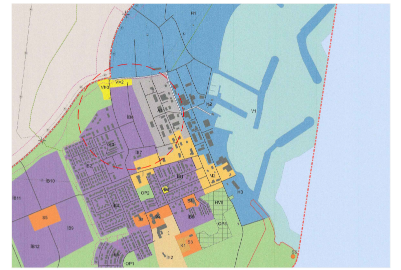
AÐALSKIPULAG ÖLFUSS 2020-2036