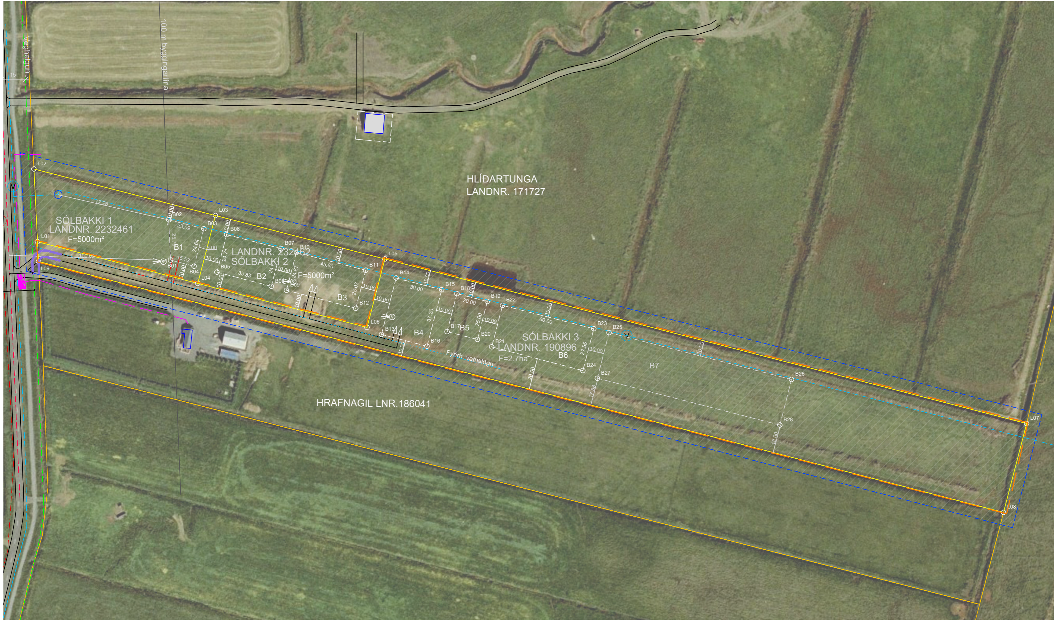
HLUTI AF GILDANDI DEILISKIPULAGI DAGS. 18.06.2015 1:1500