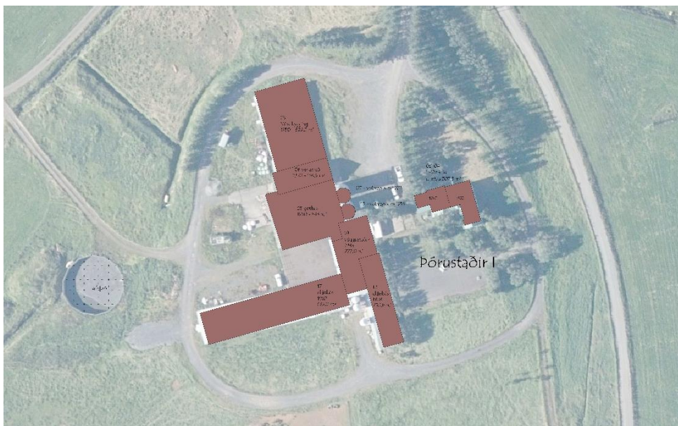
Mynd 3 Uppdráttur sem sýnir núverandi byggingar á Þórustöðum I (Teiknistofan Storð ehf, 2023)

Á svæði vestan við byggingarnar hefur verið reist safnþró sem var byggð árið 2000 og er áætlað að hún fullnægi svínabúinu með þeirri stækkun á nýjum byggingarreit norðan við núverandi byggingar.