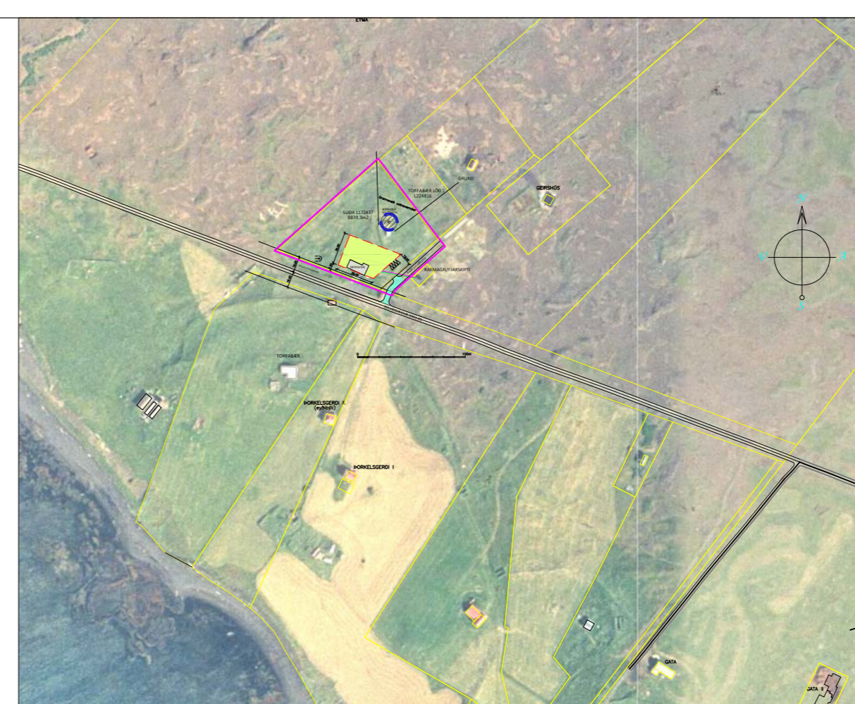
AFSTÖÐUMYND mkv 1:5.000

Aðalskipulag Ölfus 2020-2036 Teiknað í grunn frá Verkfræðistofu Suðurlands ehf. Myndagrunnur Loftmyndir ehf. Hnitakerfi ISNET 93