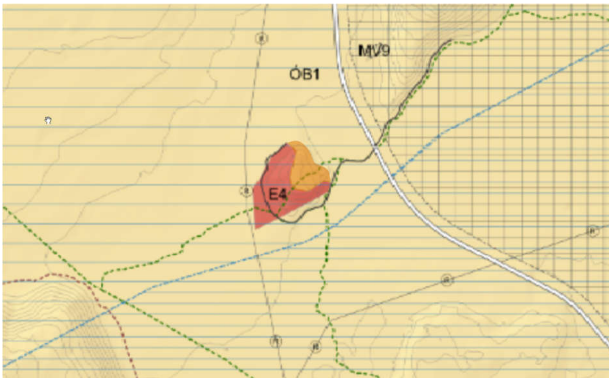
MYND 2. Hluti af Aðalskipulagi Ölfuss 2020-2036. Stækkun námunnar er sýnd með appelsínugulum fláka.