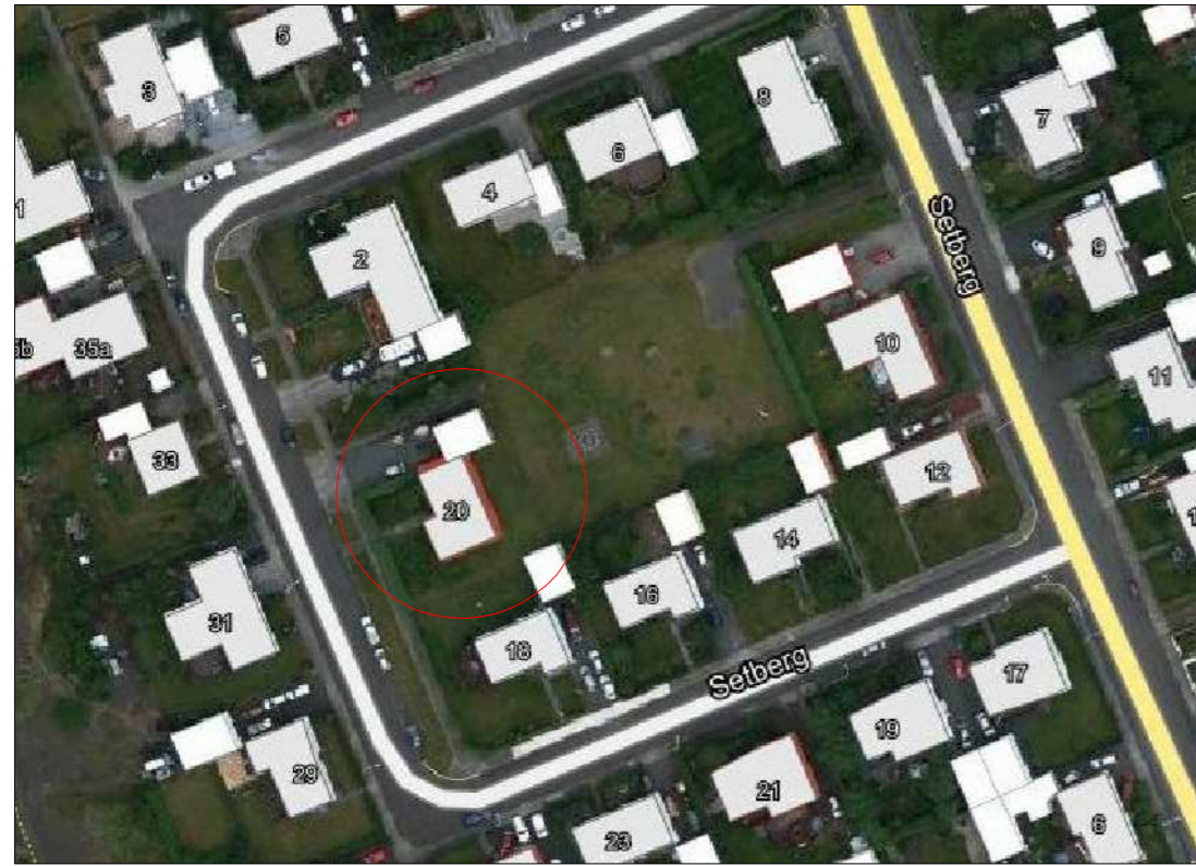
YFIRLITSMYND AF LÓÐ