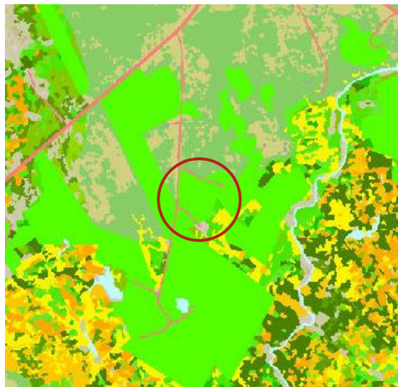
MYND 3. Vistgerðir (kortasjá Náttúrufræðistofnunar Íslands)