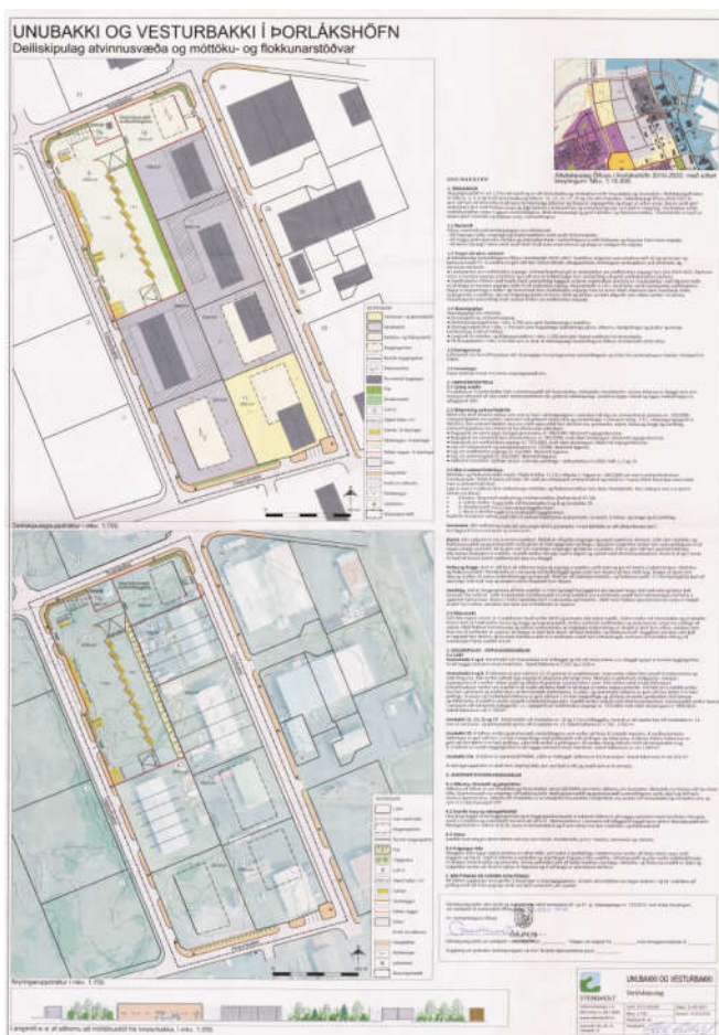
MYND 2. Gildandi deiliskipulag, Unubakki og Vesturbakki í Þorlákshöfn.