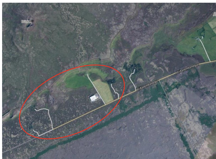
Mynd 1 Yfirlits mynd af skipulagssvæðinu.

Jörðin er mikið til hraun, sem er nokkuð mosagróið. Gras og mólendi er nokkuð kring um Geitafell og einnig sunnan hjallans, þar sem heimatún/svæði jarðarinnar er. Landi hallar til suðurs og stendur heimasvæði í skjóli við allmikinn hjalla. Skv. vistgerðakorti Náttúrufræðistofnunar er svæðið að mestu þakið lynghraunavist og sandorpnu hellu-hrauni sem er hluti af Leitarhrauni sem nýtur sérstakrar verndar skv. 61. gr. laga nr. 60-1013 um náttúruvernd. Hraunið hefur þó talsverða útbreiðslu á svæðinu og hefur þegar verið raskað vegna uppbyggingar.