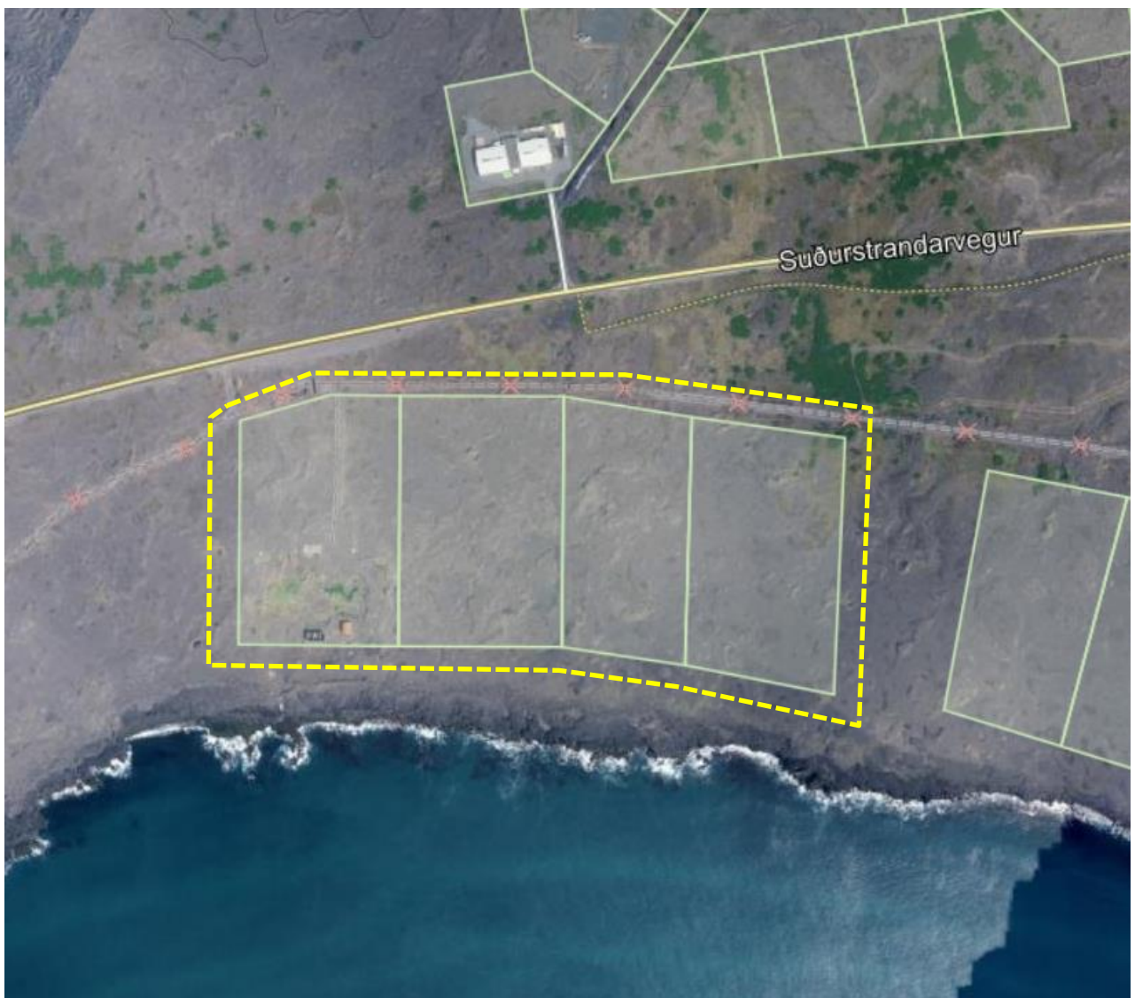
Mynd 1. Deiliskipulagssvæðið er afmarkað með gulri brotinni línu.

Tekið verður tillit til minjaskráningar í vinnu við deiliskipulag.