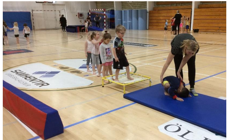
Nálægð við íþróttamiðstöð