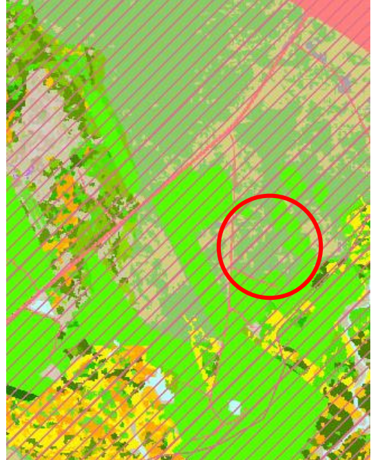
Mynd 1. Vistgerðarkort NÍ – rauður hringur sýnir skipulagssvæðið. (vefsjá NÍ apr. 2019).