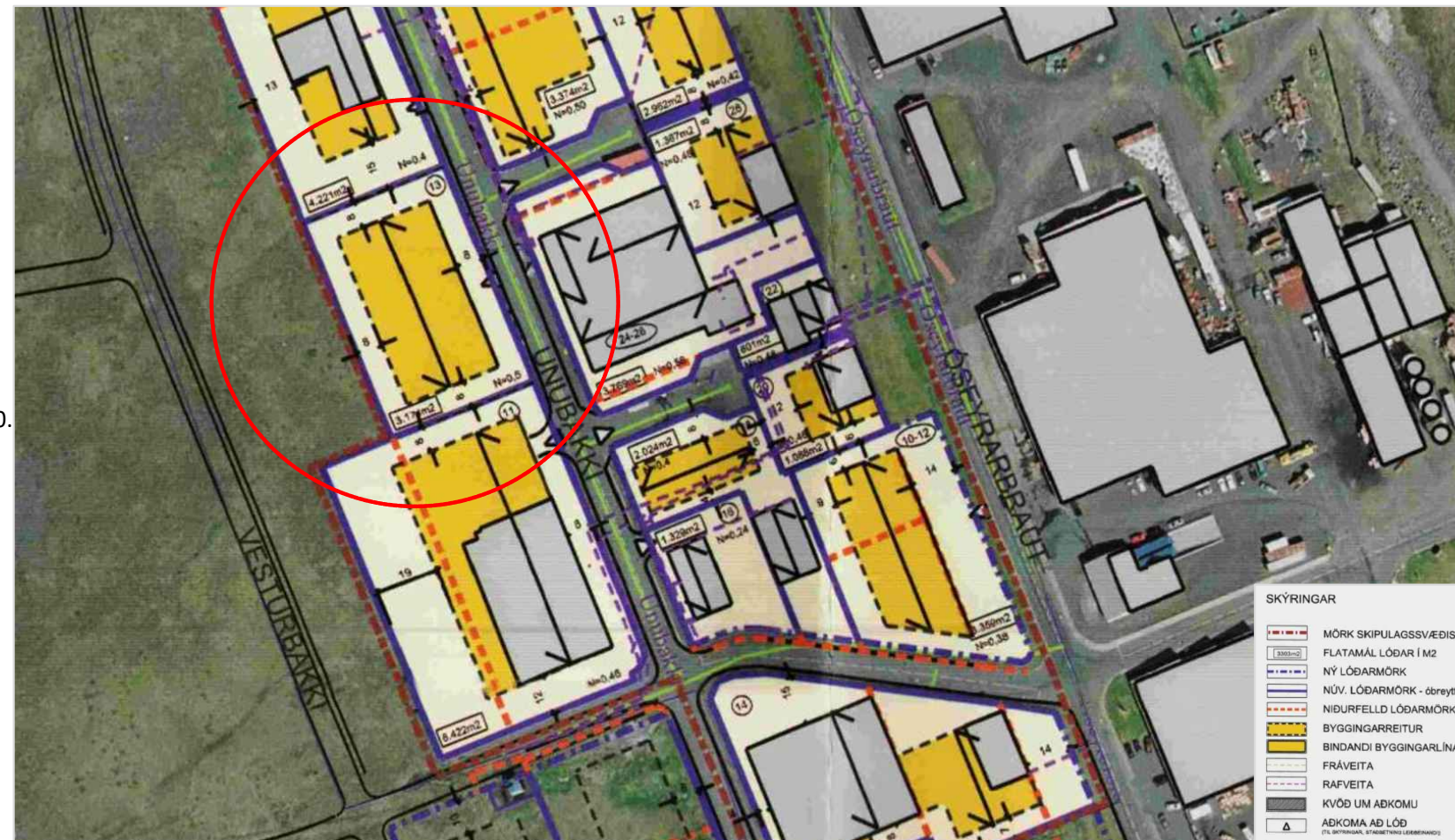
Deiliskipulagsuppráttur mkv. 1:2000 - Fyrir breytingu