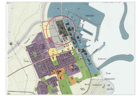
Hluti aðalskipulags Ölfus 2010-2022