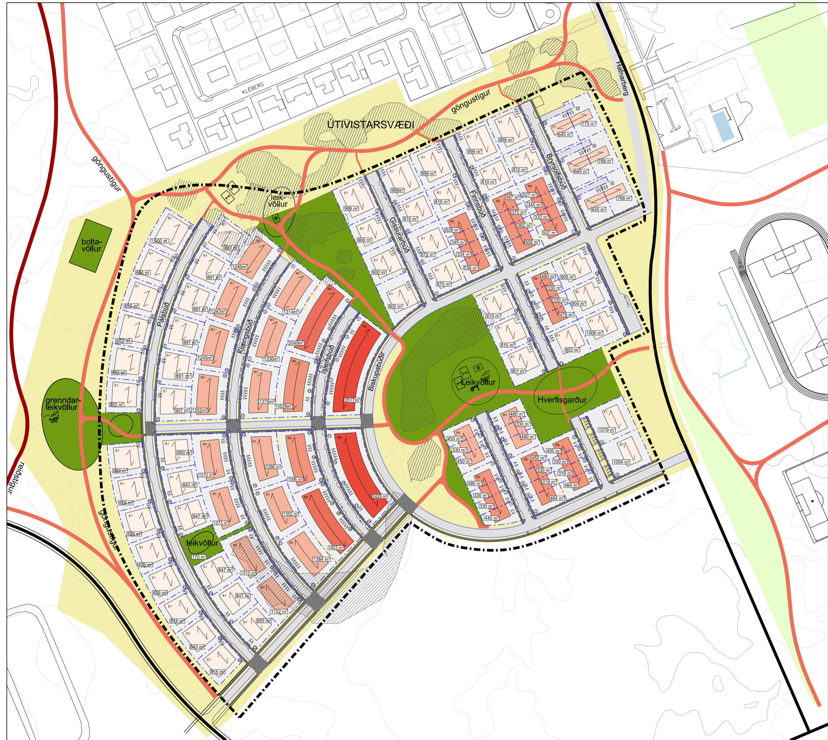
TILLAGA AÐ NÝJU DEILISKIPULAGI, APRÍL 2017 MKV. 1:2000