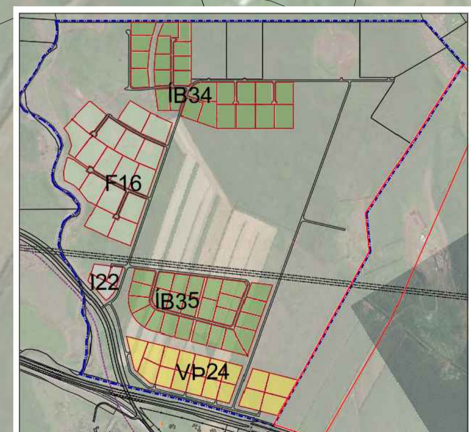
Heiti / skilgreining svæða í skipulagi

Landhönnun síf Hermann Ólafsson landslagsarkitekt FÍLA Eyrafelli 10 - 800 Selfoss s. 482 3300, 896 1809 - landhonnun@landhonnun.is