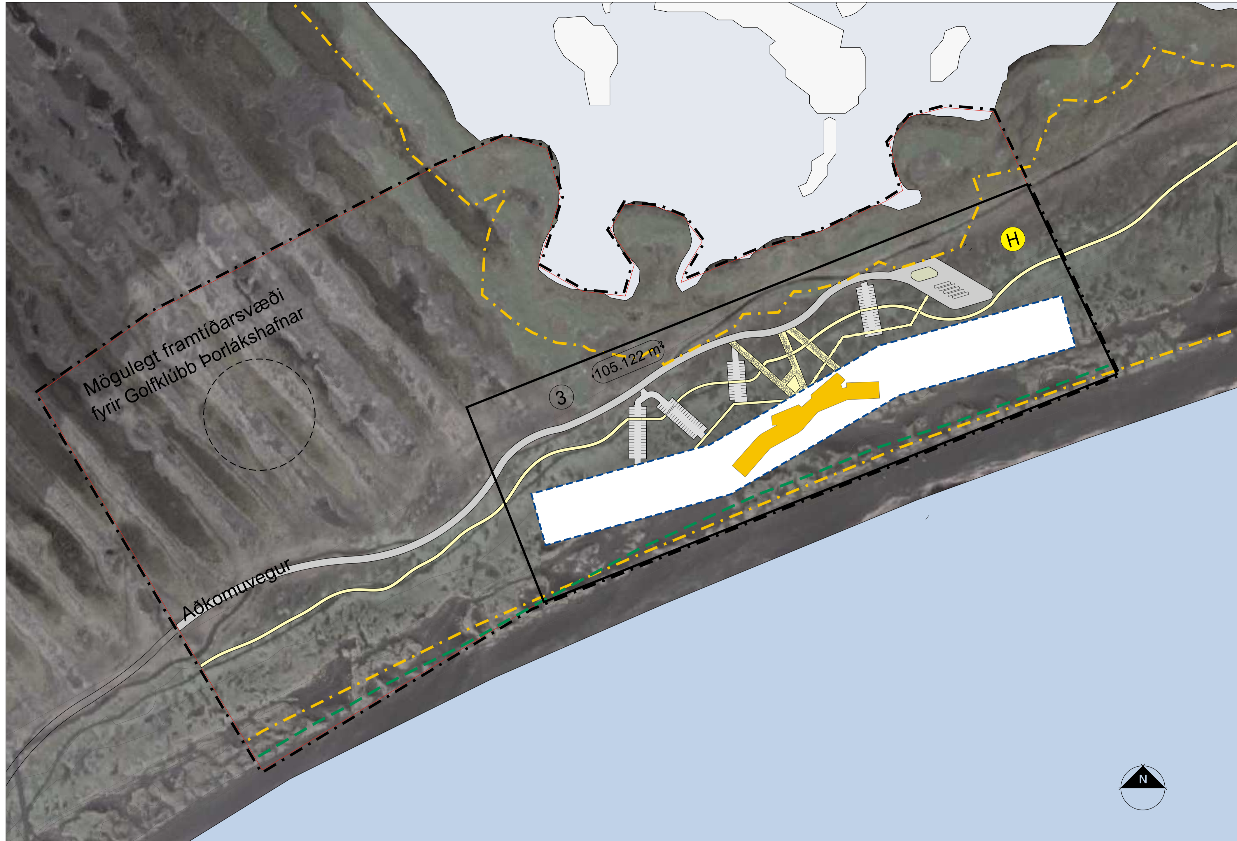
Deiliskipulagstillaga mkv. 1:2000

Greinargerð. Um er að ræða nýtt deiliskipulag. Atmörkuð er ný lóð fyrir verslun- og þjónustu 10,5 ha að stærð. Aðkoma að lóðinni er um Vallarbraut frá golfskála.