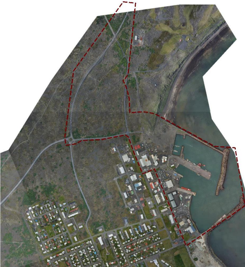
MYND 1. Sjá má afmörkun skipulagssvæðisins með rauðri brotinni línu.

Ráðgjafar við skipulagsvinnuna eru Steinsholt ehf og EFLA verkfræðistofa.